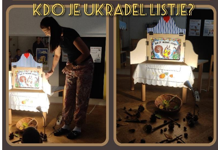
KDO JE UKRADEL LISTJE?