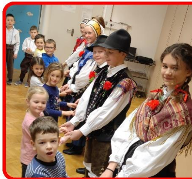
Vključitev otrok v folklorni nastop