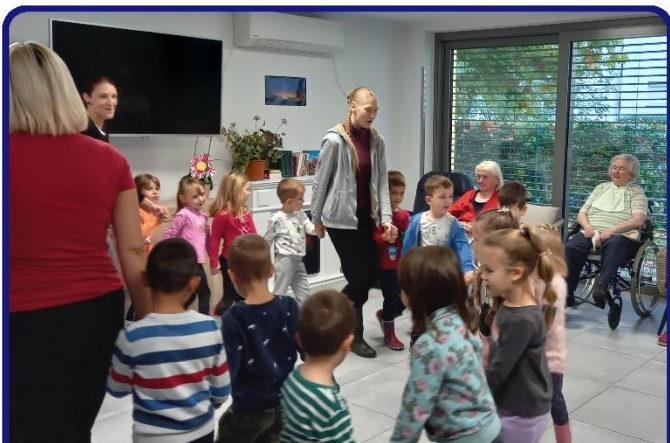
Nastop v centru Spominčica - otroci starejšim z demenco